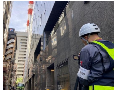
定期報告が必要な特定建築物・防火設備・建築設備・昇降機及び報告時間一覧