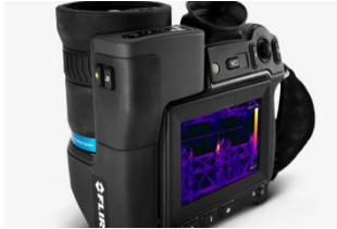
赤外線による外壁調査 (画像の機器はイメージです)